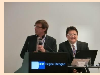
TOGO SCHERDEL GmbH 橋場副社長、ロートエグゼクティブ・マネージャー