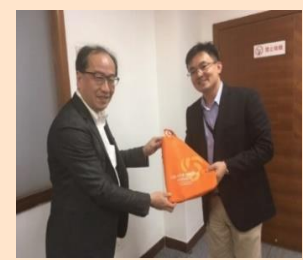
G N I 深センミッション