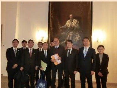
バイエルン州庁舎内にて