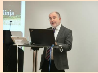
シュトゥットガルト商工会議所副専務理事の開催挨拶