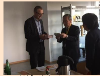
G N地域に進出したTUENKERS 訪問の様子(ドイツミッション)