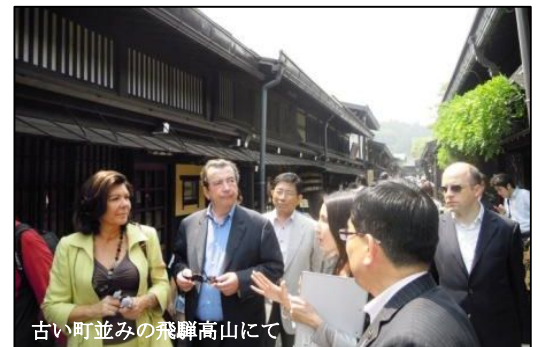
古い町並みの飛騨高山にて