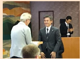
岐阜県河合副知事