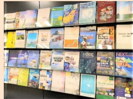
JETRO本部対日投資・ビジネスサポートセンター 外資系企業向け情報コーナー