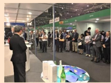
レセプション (展示会にて)