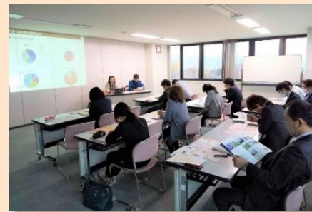
各務原市役所、各務原商工会議所にて「勉強会: GNIの活用について」

・GNI協議会より活動紹介。大堀研磨工業所(各務原市内企業、GNIパートナー企業)から、GNIを通してどのように企業のグローバル化を進めたか説明。