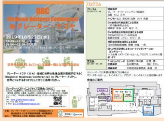
当日配付プログラム